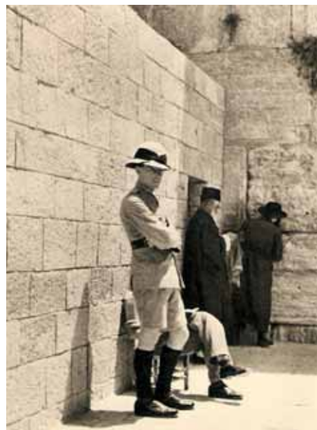
Британский полицейский на посту у Стены, 1934 год