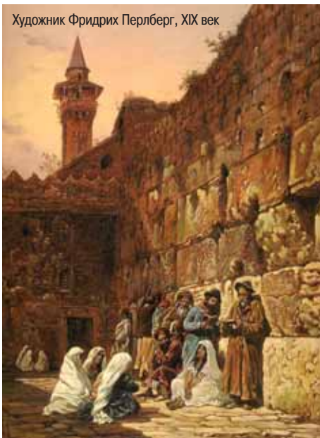
Художник Фридрих Перлберг, XIX век