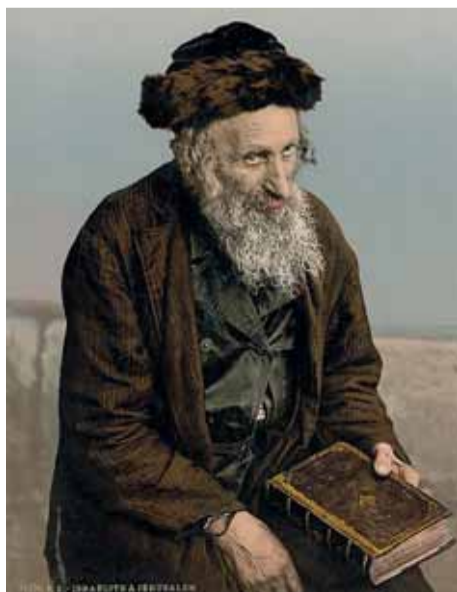
Еврей из старого Иерусалима, литография XIX века

И вот, став в конце 1830-х признанным лидером британского еврейства, он посвящает свою жизнь защите еврейских интересов по всему миру. Так, в 1840 году, возглавив группу просвещенных представителей держав Запада, добился у османского правителя Сирии публичного оправдания евреев