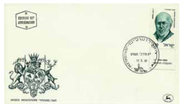
Почтовая марка Израиля, посвященная Мозесу Монтефиоре, на конверте с изображением его герба и памятным почтовым штемпелем, 1981 год

Не остался безучастен Монтефиоре и к положению евреев в Российской империи, дважды побывав в Санкт-Петербурге: в 1846 году он был принят Николаем I, а в 1872-м – Александром II. Но важных последствий эти визиты не имели, хотя на просьбу об улучшении жизни его единоверцев Николай I учтиво ответил: «О да, они получают права, когда станут похожи на вас».