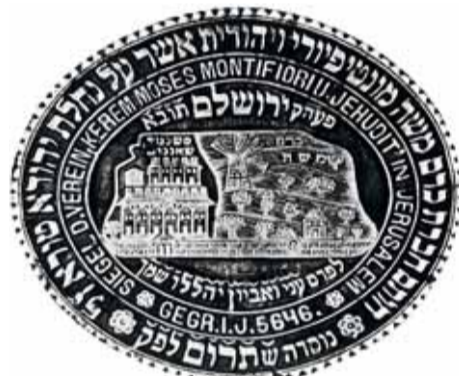
Личная печать сэра Мозеса Монтефиоре

Хотя Палестину Мозес Монтефиоре впервые посетил намного раньше, еще в 1827 году. Кстати, после этой своей поездки он стал много серьезней относиться к религиозным еврейским традициям, отныне даже путешествуя только с личным шойхетом. Подобных поездок он в своей жизни предпринял целых семь – помимо первой, в 1827-м, он приезжал в Эрец Исраэль в 1839, 1849, 1855, 1857, 1866 и 1875 годах. И почти сразу же первейшим предметом его забот стала помощь палестинским евреям, живущим в последней степени нужды. И это были не просто крупные финансовые пожертвования (деньгами он помогал и многим другим