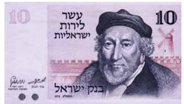
Банкнота Банка Израиля номиналом 10 лир, 1973 год

Впрочем, и до того, и позже Монтефиоре был к Иерусалиму особо внимателен – его попечением там открылись аптека и поликлиника, где с 1843-го принимал доктор Френкель, первый на всю страну дипломированный врач. Кроме уже