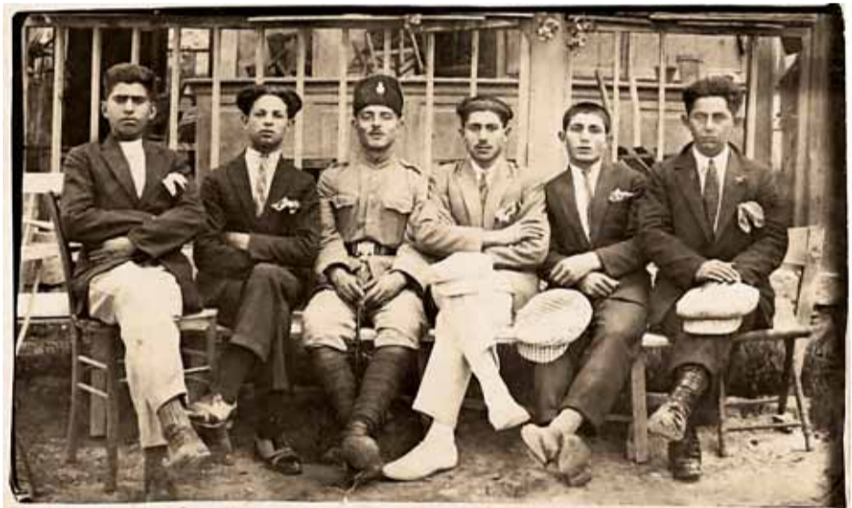
Переселенцы второй алии (1904–1914) из России – молодые горские евреи. Палестина, начало 1920-х

Но история эта затянулась, и даже смерть Герцля в 1904 году не примирила противников. Правда, сперва угандийские земли признали негодными для заселения, затем выяснилось, что против появления евреев возражают местные