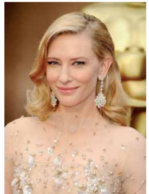
Кейт Бланшетт — «Оскар» за лучшую женскую роль