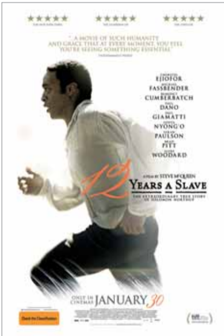
Киноакадемики потрясли «12 лет рабства» — исполненная трагизма история из середины XIX века

орбите военного спутника. Их попытки спастись с помощью Международной космической станции, корабля «Союз» и китайских станции и корабля — увлекательнейшее зрелище, но главное при этом не катастрофа и не головокружительные спецэффекты, а эмоциональное и духовное преображение героини Сандры Буллок.