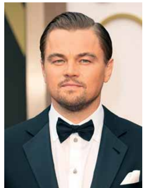
У Леонардо Ди Каприо есть поводы для грусти — его провокационный фильм «Волк с Уолл-стрит» оказался не по зубам Американской киноакадемии

Так или иначе — самая престижная киноцеремония осталась позади. Ее будут вспоминать, анализировать, дополнять пророчествами на 2015 год. Эти прогнозы могут сбыться или не сбыться, но одно можно сказать точно — звезды кинематографических небес, как и всегда, в этот день будут вращаться исключительно на орбите «Оскара».