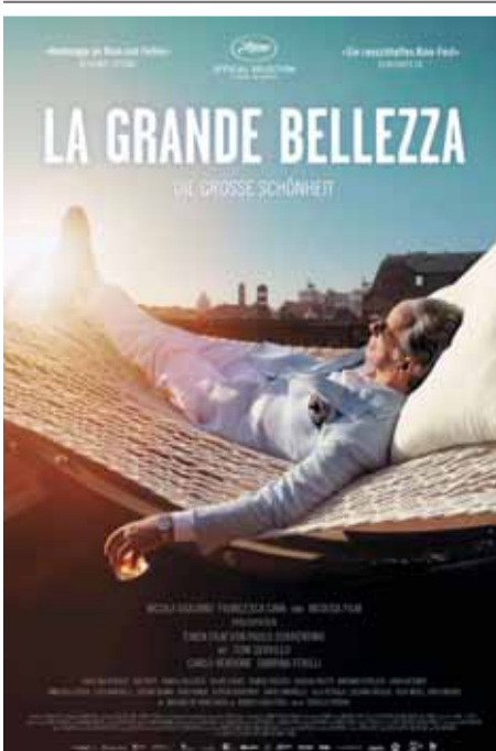
«Великая красота» — язвительный кинопортрет утопающего в неге декадентского Рима