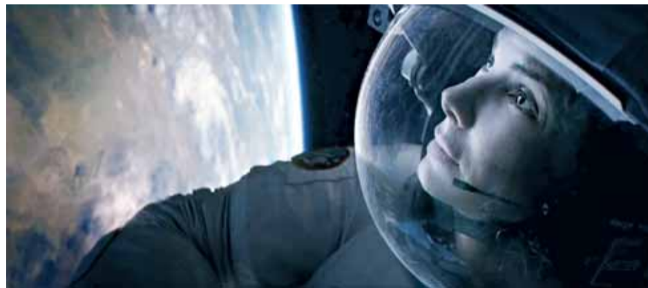
«Гравитация» Альфонсо Куарона — завораживающая игра двух актеров в бесконечности космоса