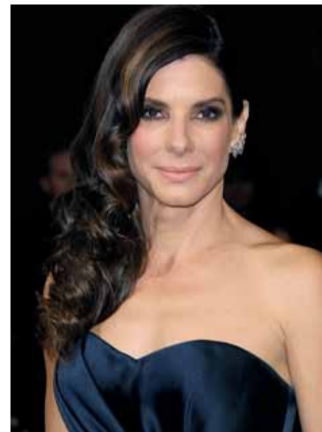
Сандра Буллок — звезда «Гравитации»