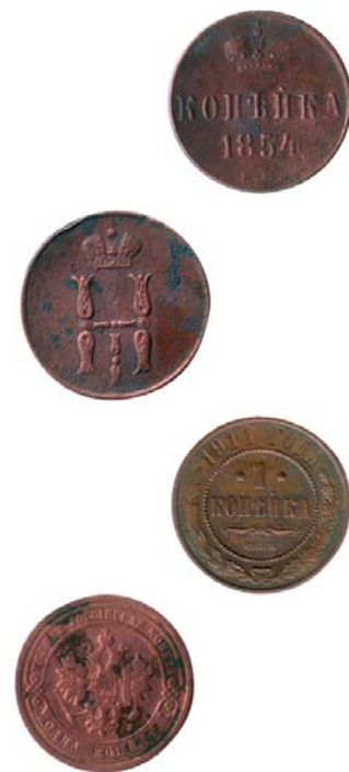
Копеечки двух Николаев – Первого и Второго