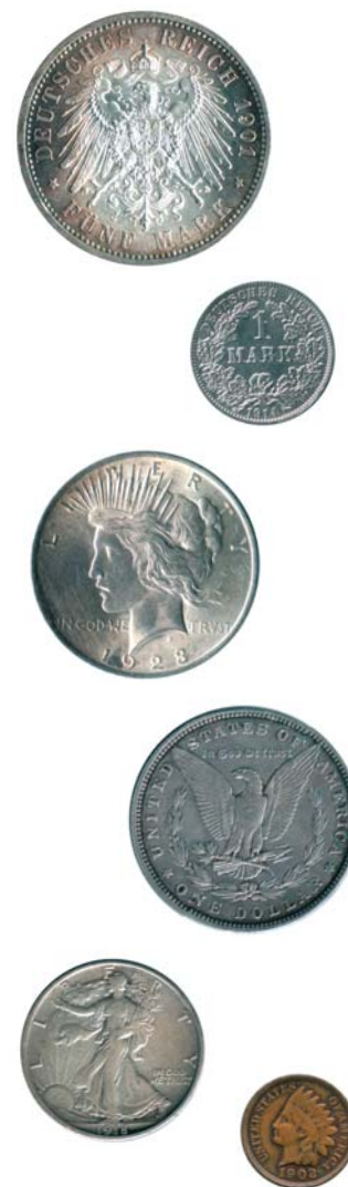
У наших противников и союзников по Первой мировой войне тоже до поры до времени водилась в карманах звонкая монета

После Февральской революции Временное правительство продолжило печатать ничем не обеспеченные деньги – как «романовские» кредитные билеты, так и свои 250- и 1000-рублевые. Денег не хватало катастрофически, и в обращение были выпущены 20- и 40-рублевые бумажки, больше похожие на спичечные этикетки (в народе их презрительно прозвали керенками). Впрочем, мечты о стабилизации денежного обращения и твердом рубле оставались и у Временного правительства – заказ на печать большого количества кредитных билетов нового образца был размещен в Америке. Американцы подошли к делу ответственно, купюры получились красивыми и солидными, похожими на американские доллары, и, конечно, на них имелась надпись о размене на золото – правда, без всяких ненужных подробностей вроде указания курса размена. Вот только получить свой заказ Временное правительство не успело – когда эшелоны с новыми деньгами пошли с Дальнего Востока на Питер и Москву, на всем этом дальнем пути была уже совсем иная власть, причем чуть не в каждом городе своя, и всякой власти нужны были свои деньги. В общем, до столиц денежный груз так и не доехал, и теперь все эти банкноты мы