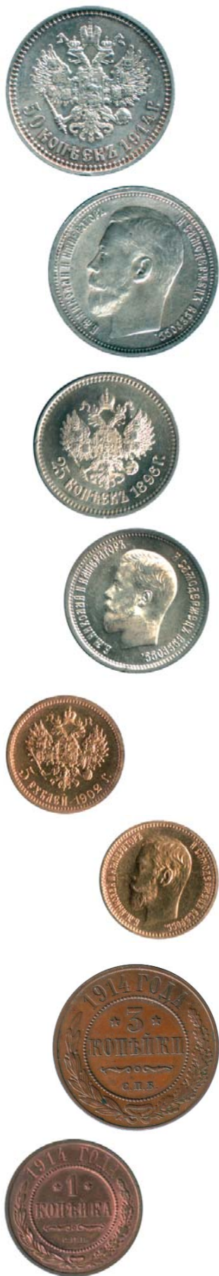
Вот они, твердые николаевские деньги, одна из самых надежных валют мир – до 1914 года

золото брать. И в самом деле – бумажки и удобнее, и карман не оттягивают. Золотая монета, столь успешно и в больших количествах внедренная Витте в оборот, проигрывала в удобстве кредитным билетам – и к 1913 году количество золота в обращении упало до рекордно низкого уровня.