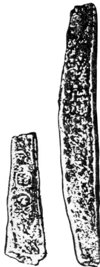
Полтина и рубль из того самого иностранного серебра, XIII век

Но более «дорогой» монеты, чем копейка, на Руси так и не появилось – а это сильно мешало при крупной торговле. Конечно, при покупке хоть кафтана, хоть сапог, хоть даже лошади или коровы вполне хватало копеек, которые вмещал кошелек небедного москвича или селянина. Но только представьте, как все осложнялось, когда речь шла о крупных купцах и расчетах на сотни или тысячи рублей. Да, на Руси существовали более крупные денежные единицы – рубль и полтина (50 копеек)... но, повторяю, это были только условные, счетные понятия. То есть для того чтобы заплатить 100 рублей, надо было отсчитать 10 000 крохотных копеек – а если речь шла о еще больших суммах??? Приходилось содержать целый штат