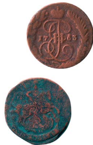
Тяжеловесные пятаки Екатерины II

При этом выявился один курьезный просчет – население, убедившись, что бумажки в любой момент можно поменять на золото, перестало это