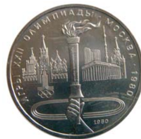
Олимпийский рубль, подзабытая уже классика...