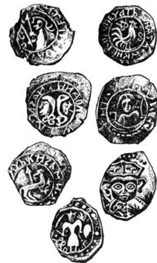
Серебряные монеты удельных княжеств