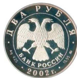
Серебро независимой России – не ищите эту монету в своих карманах