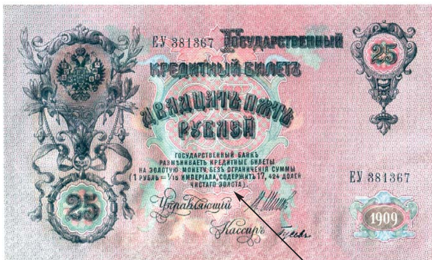
Размен этой купюры на золото действительно обеспечивался – всем достоянием Российской империи

Как мы знаем из истории, миновать «чрезвычайным обстоятельствам» в Российской империи уже было не суждено. Серебряную и медную мелочь в небольших количествах продолжали по инерции чеканить аж до 1917-го, но все, что Государственный банк выпускал в обращение, сразу оседало на руках и припрятывалось до лучших времен. Недостаток разменной монеты ощущался настолько, что правительство вынуждено было пойти на выпуск бумажных билетов мелких номиналов – от 1 до 50 копеек, и к 1916 году денежное обращение в стране фактически стало полностью бумажным. Как любопытный курьез можно привести историю с почтовыми марками из юбилейной серии, выпущенной в 1913 году к 300-летию юбилею династии Романовых. В годы Первой