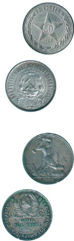
Первое и последнее серебро Советской России