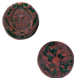
Деньги 1748 года