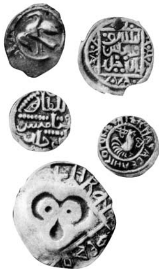
Серебряные деньги великого княжества Суздальско-Нижегородского, великого княжества Московского и великого княжества Рязанского, XV век

Фальшивомонетчиков наказывали способами вполне средневековыми – и руки рубили, и раскаленным железом клеймили, а чаще всего заливали им горло расплавленным оловом и свинцом. Кроме акта устрашения, это символизировало утолнение алчности преступника тем материалом, из коего он фальшивые деньги делал