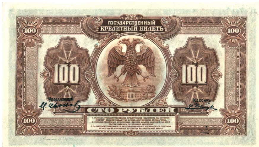
«Американские» рубли Временного правительства, до заказчика так и не дошедшие

можем увидеть с множеством разноцветных штемпелей и подписей всяких местных правительств и правителей.