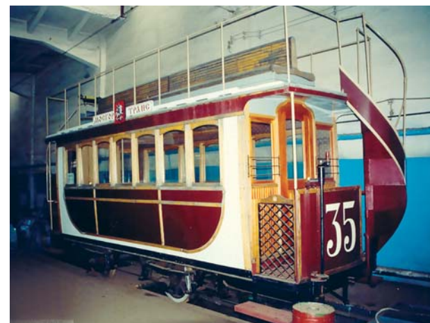
Вагоны конки конца XIX века радовали москвичей своим изяществом

возок. Но в первые же спокойные 1920-е годы в трамвайные парки столицы начали поступать новые четырехосные трамваи Коломенского моторного завода. В 1930-х годах из них и прицепных вагонов стали составлять трехвагонные поезда. Мытищинский завод в 1938 году приступил к производству вместительных трехдверных вагонов ТМ-38. В первые послевоенные 1940-е на Тушинском машиностроительном, а затем на Рижском вагоностроительном заводе началось производство трамваев МТВ-82 и МТВ-82Б. Эти трамваи вместе с двухвагонными поездами с моторными вагонами БФ и КМ и прицепными С были основой трамвайного парка Москвы до начала 1970-х годов. Правда, с конца 1950-х в столицу поставлялись трамваи Т-1 и Т-2 производства чехословацкого завода Tatra. В середине 1980-х все остальные трамваи были сняты с эксплуатации, и в Москве осталось только 1300 вагонов чехословацкого производства. С конца 1980-х годов на некоторых московских маршрутах начали эксплуатироваться вагоны Усть-Катавского завода.