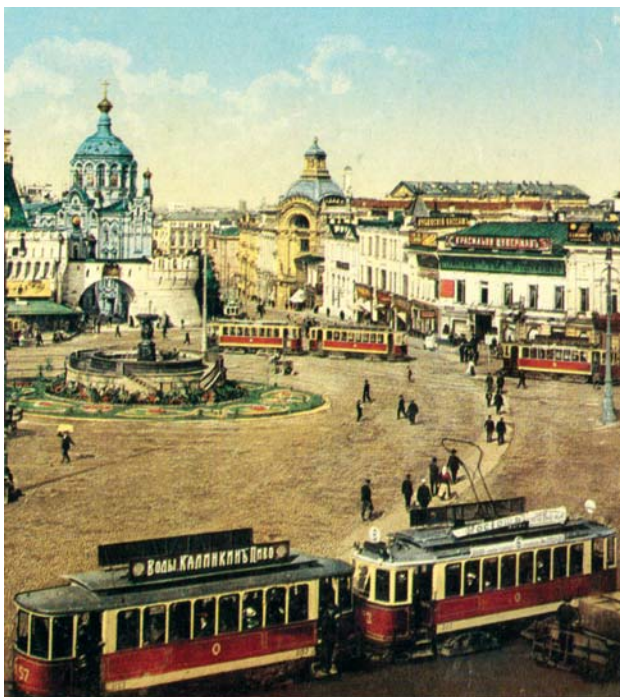
Трамвай на Лубянской площади, 1910 год

Менее чем через неделю те же «Русские ведомости» добавили: «Несколько дней тому назад в Москве открылось новое увеселение для москвичей – конно-железная дорога. Всякий раз отправление вагона привлекает многочисленную толпу зрителей, и москвичи по целым часам стоят и глазекуют на невиданное ими зрелище. Вагоны переполнены публикой, по большей части едущей просто ради любопытства посмотреть, как ездят по таким дорогам. Впрочем, я опасаясь, что наша железно-конная дорога и впредь будет служить только для катания праздной публики. Дело в том, что до сих пор нигде не публикуется о месте и времени отхода вагонов; кроме того, если бы деловой человек вздумал проехать от Охотного ряда к станции Смоленской дороги, то ему пришлось бы, запла-