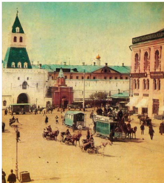
Конка на площади у Ильинских ворот, конец XIX века

10 копеек внизу и 5 копеек наверху вагона. Теперь, когда полотно конно-железной дороги исправлено, вагоны идут быстро и легко. В местах, где приходится подниматься в гору, к двум лошадям припрягаются впереди еще одна-две, с мальчиком-форейтором. Разъезд для вагонов около старых Триумфальных ворот уже закончен, и в случае надобности могут быть выведены на дорогу все 10 вагонов, состоящие в распоряжении компании».