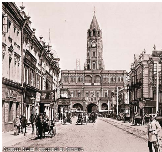
Сухарева башня и городовой на Сретень

По Сретенке, через Сухареву башню, проходила одна из самых популярных линий конки, а затем и трамвая. 1905 год