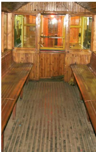
Вагон конки образца 1898 года изнутри