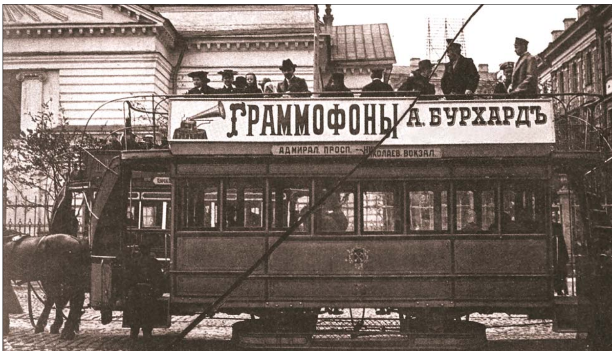
Первые же вагоны конки стали использоваться для помещения рекламы – и от рекламодателей не было отбоя

К 1860 году население Москвы составляло почти 600 000 человек. Город рос не по дням, а по часам, и без современной системы транспорта было никак не обойтись. Из общественного транспорта в Москве к этому времени имелись только линейки – небольшие многоместные конные экипажи, но для удовлетворения транспортных потребностей москвичей их явно не хватало. Необходимость перемен понимали все – первое заседание городской Думы, где обсуждались перспективы устройства линий конного трамвая (тогда это называлось конно-железной городской дорогой), состоялась